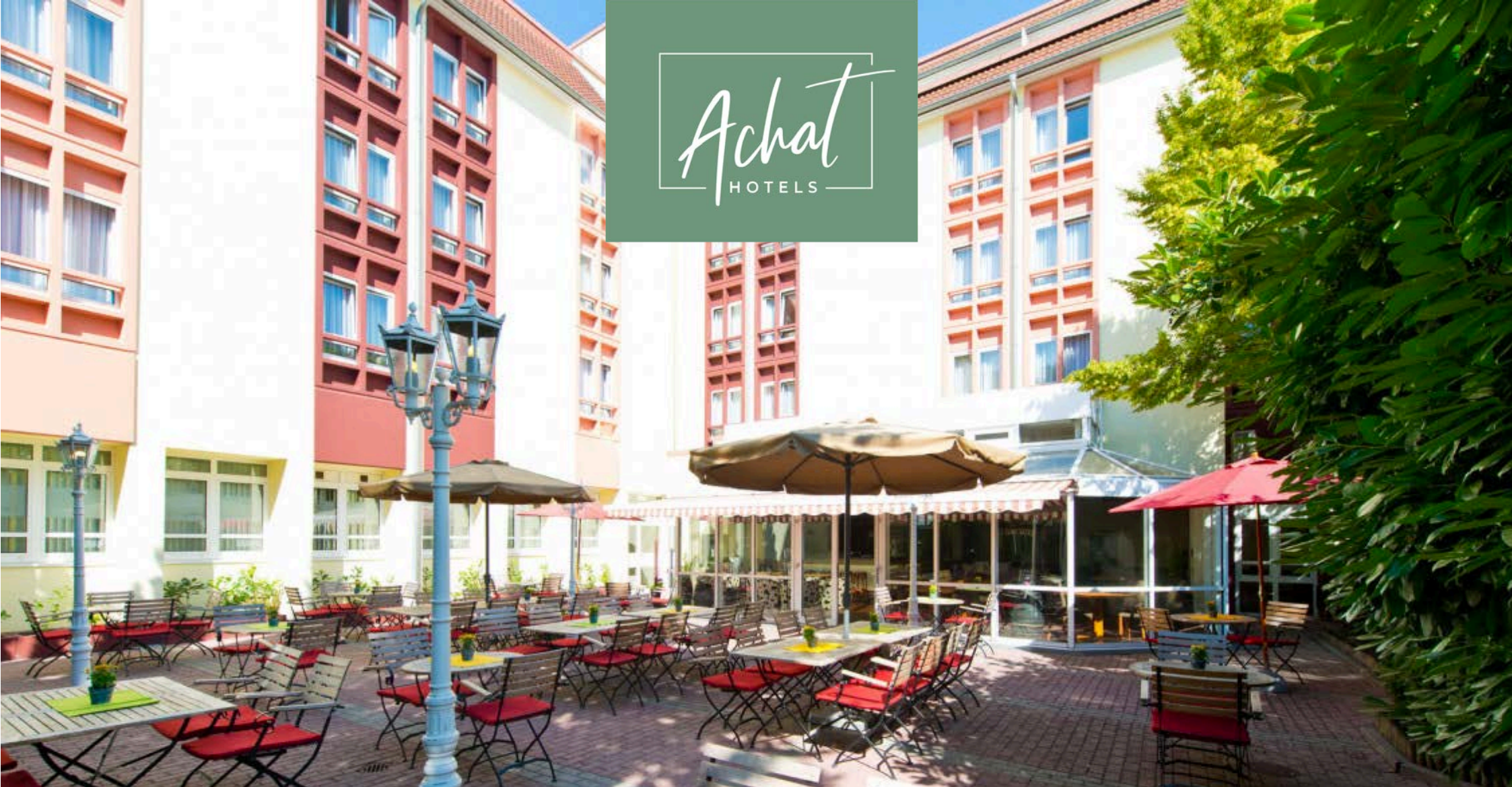
ACHAT Tagungshotel Neustadt Weinstraße