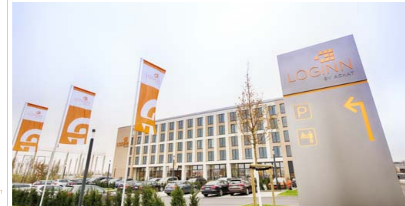
LOGINN Hotel Leipzig by ACHAT