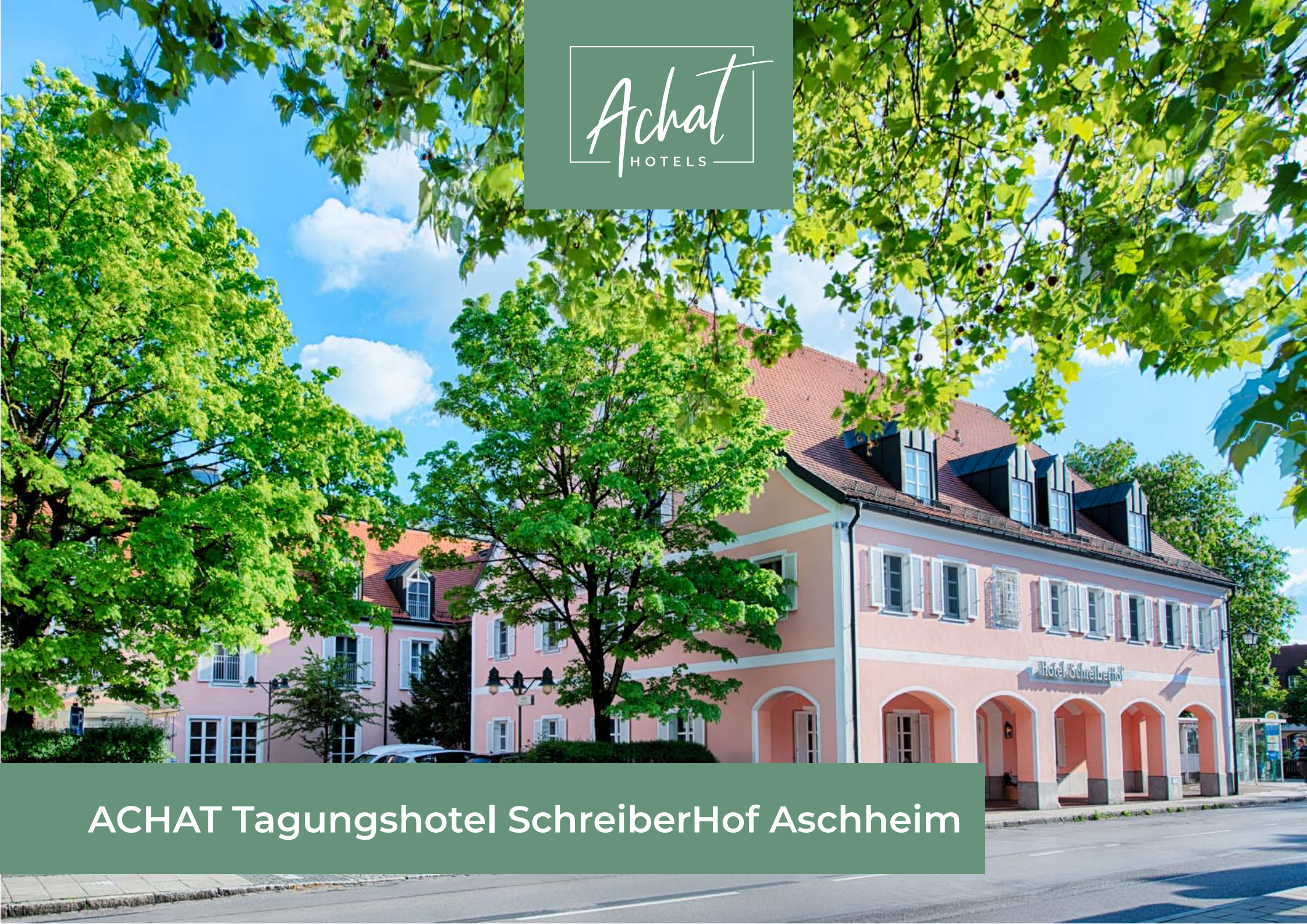
ACHAT Tagungshotel SchreiberHof Aschheim