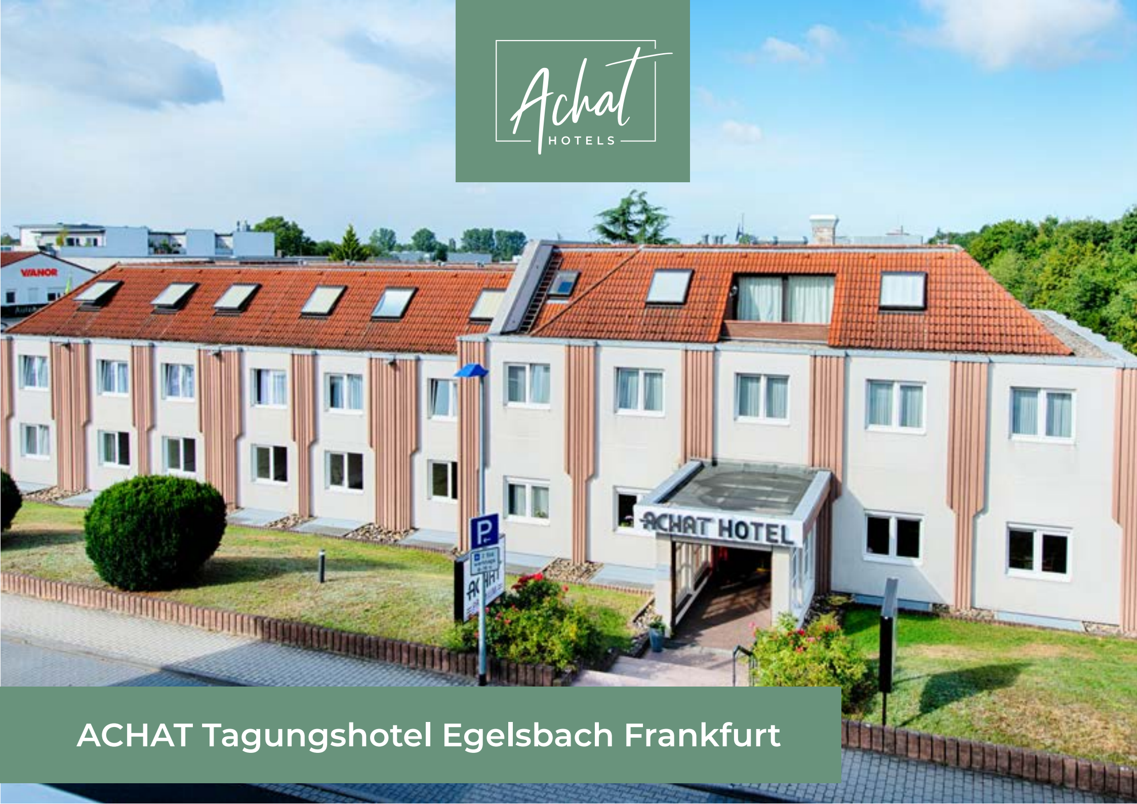
ACHAT Tagungshotel Egelsbach Frankfurt