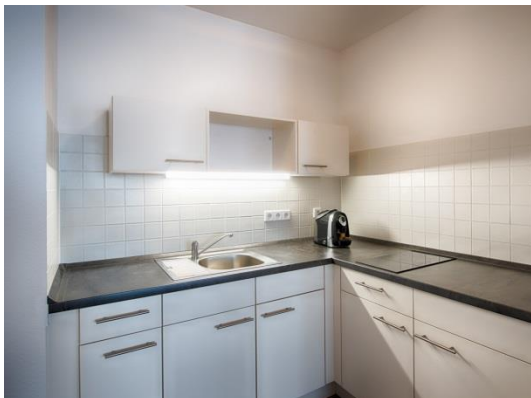
ACHAT Comfort Dresden