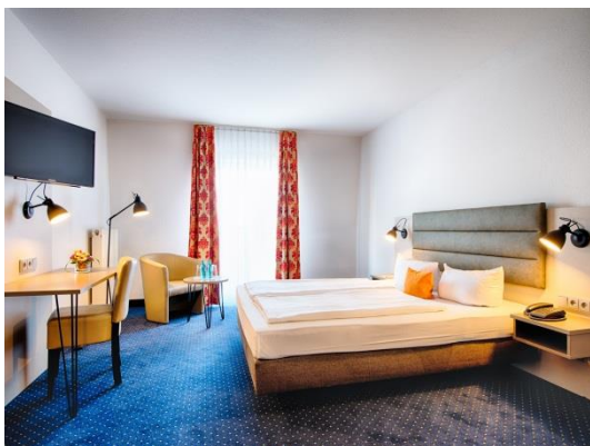
ACHAT Premium Zwickau